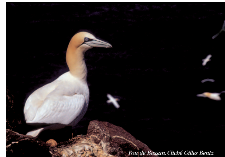
Fou de Bassan.

Autre intérêt : la présence du phoque gris avec une trentaine d'individus. Des naissances régulières sont observées depuis