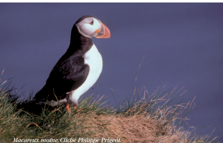
Macareux moine.

Au début du XX e siècle, le tourisme commençait à se développer et tous les prétextes étaient bons pour attirer les voyageurs. C'est ainsi que les chemins de fer de l'Ouest vantaient, par voie d'affiche, la chasse au « perroquet de mer » à Perros-Guirec. De fait, les chasseurs exécutaient, en période de nidification, de véritables carnages de macareux qu'on ramenait par pleines barques au port... pour les jeter sur la grève. Alertée par un de ses adhérents, en 1911, la Ligue pour la Protection des Oiseaux (LPO) créa la réserve des Sept-Iles en 1912, en louant le territoire.